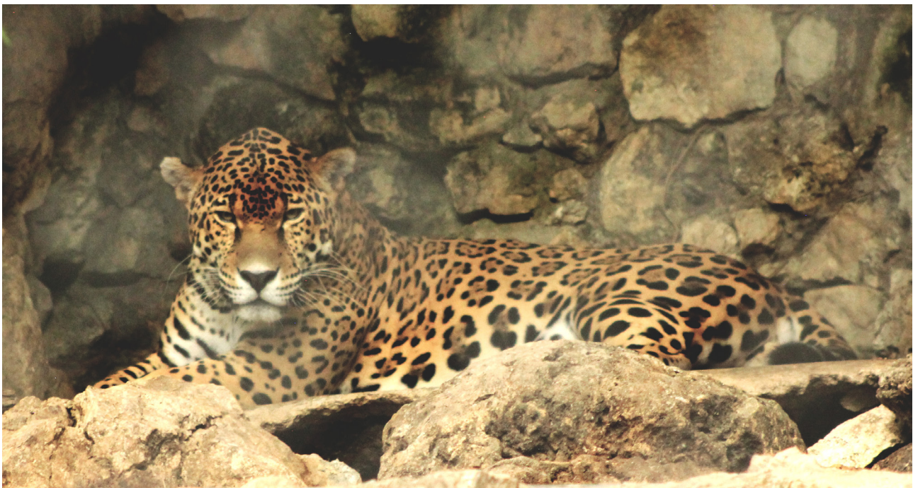
Figura 2. Patrón de coloración y manchas negras del jaguar como se presentan en la descripción de la especie.

La importancia del jaguar para los pueblos indígenas de México es extraordinaria y tiene una historia compleja y profunda, en especial en los ámbitos de la cosmovisión, universo simbólico y mitología, pero no únicamente. De la relevancia religiosa del jaguar se puede citar, por ejemplo, su presencia como uno de los días del calendario adivinatorio mesoamericano: ocelotl entre los antiguos nahuas, o nisin según los totonacos contemporáneos (Stresser-Péan, 2011). Tal vez el aspecto más generalizado en cuanto a la presencia del jaguar en la cosmovisión de los pueblos de tradición mesoamericana es que se trata del animal más importante que funge como alter ego o coesencia de personas sobresalientes y poderosas, dentro de lo que se conoce como nahualismo y tonalismo (Saunders, 1994). Como dicen tsotsiles, tseltales y tojolabales: “si un cazador mata un jaguar, entonces muere la persona que era su compañera” (Acheson, 1966; Figuerola, 2010; Ruz, 1983). La preeminencia de este felino también se observa en el hecho de que se considera el ancestro o antepasado de algún pueblo, por lo que no